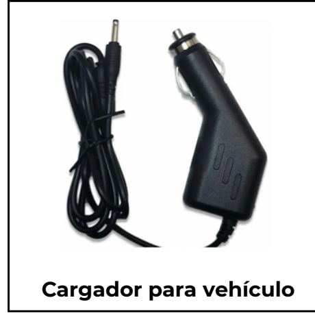
Cargador para vehículo